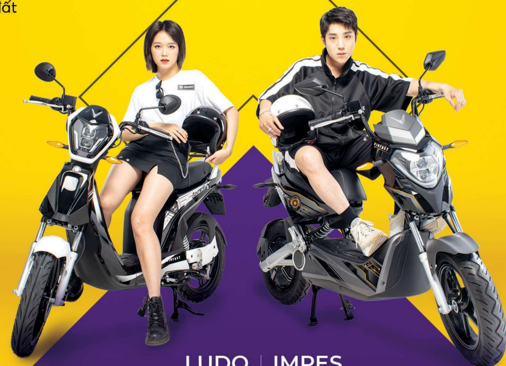
LUDO | IMPES

Hiện đại, linh hoạt với thiết kế nhỏ gọn, dễ dàng di chuyển, vận hành