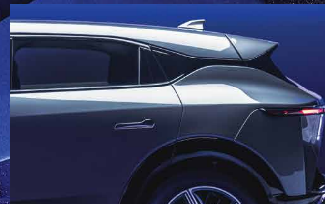
NẮP CAPO THẤP & CÁNH GIÓ MỞ RỘNG Bút phá & Tối ưu khí động học