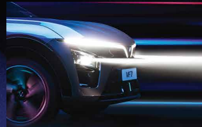
ĐÈN PHA LED ĐIỀU CHỈNH GÓC CHIẾU THÔNG MINH* Văn minh & An toàn