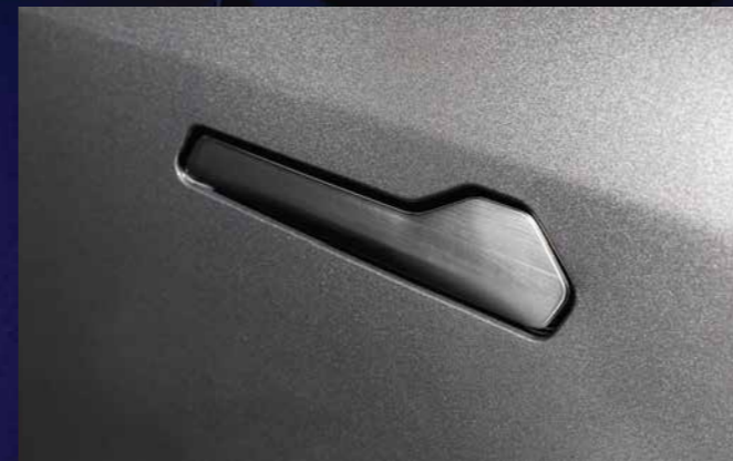
TAY NẮM CỬA ẨN Tinh tế & Hiện đại