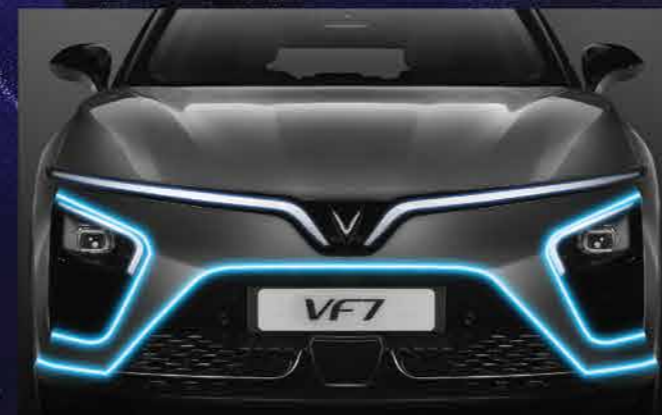
THIẾT KẾ ĐẦU VÀ ĐUÔI XE PHONG CÁCH HÀNG KHÔNG VŨ TRỤ Táo bạo & Mạnh mẽ