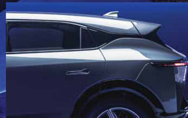
NẮP CAPO THẤP & CÁNH GIÓ MỞ RỘNG Bứt phá & Tối ưu khí động học