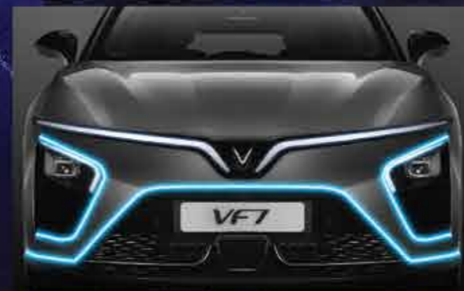
THIẾT KẾ ĐẦU VÀ ĐUÔI XE PHONG CÁCH HÀNG KHÔNG VŨ TRỤ Táo bạo & Mạnh mẽ