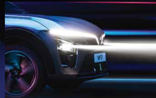
CỤM ĐÈN TRƯỚC LED ĐIỀU CHỈNH GÓC CHIẾU THÔNG MINH* Văn minh & An toàn