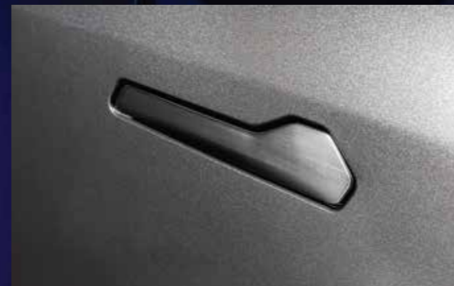
TAY NẮM CỬA ẨN Tinh tế & Hiện đại