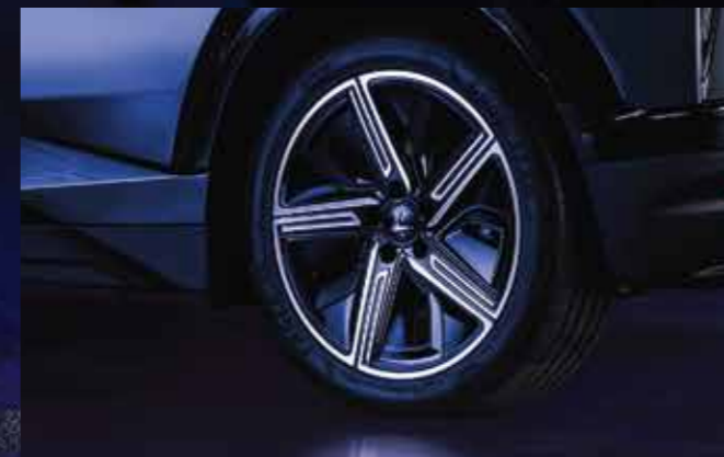
LA-ZĂNG 20 INCH* Sang trọng & Thể thao