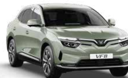
Xanh lá nhạt Urban Mint