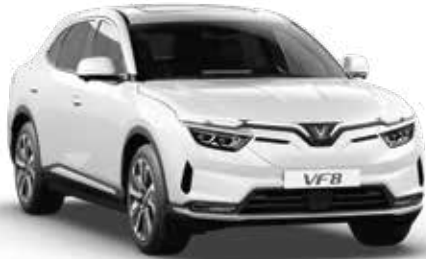
Trắng Infinity Blanc