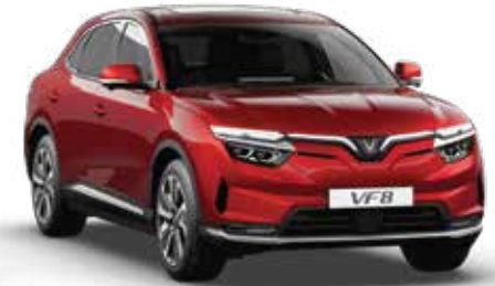
Đỏ Crimson Red