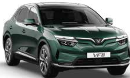
Xanh lá đậm Ivy Green