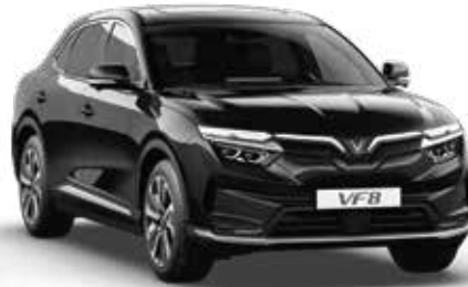
Đen Jet Black