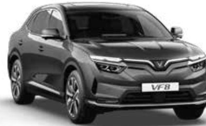
Xám Zenith Grey