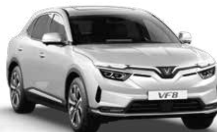
Bạc Desat Silver